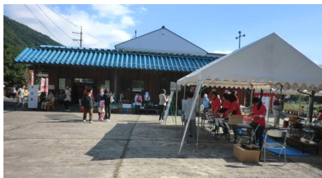
新鮮な野菜がならぶ

西郷村づくり協議会では、毎回、イベント会場を集落の持ち廻りとし、それぞれの地区の特性を生かした取り組みを内外に発信しています。今年の会場となった北村集落では、農産物の販売、イノシシ料理、名勝三滝溪谷の高山名水をはじめ、集落内の旧家や寺、名木など、数多くの“魅力”が紹介されました。視察の参加者は10人でしたが、大変感銘を受け有意義な研修となりました。