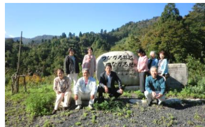
大規模林道開通記念碑で記念撮影