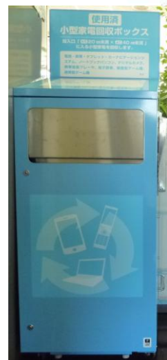
↑設置された 小型家電回収ボックス