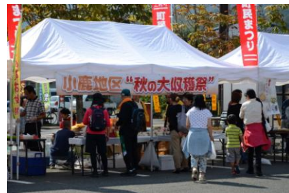
にぎわう小鹿の“秋の大収穫祭”