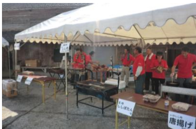
いしの唐揚げもありました