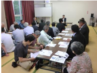
森下組合長あいさつ