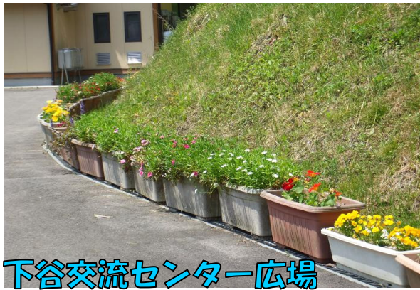
下谷交流センター広場