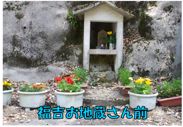
福吉お地蔵さん前