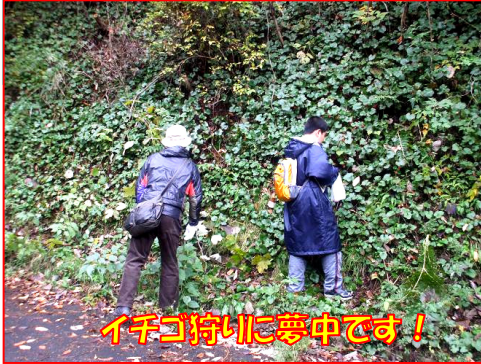
イチゴ狩りに夢中です！