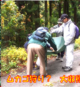
ムカゴ狩り？ 大収穫で後のお楽しみはいつですか！