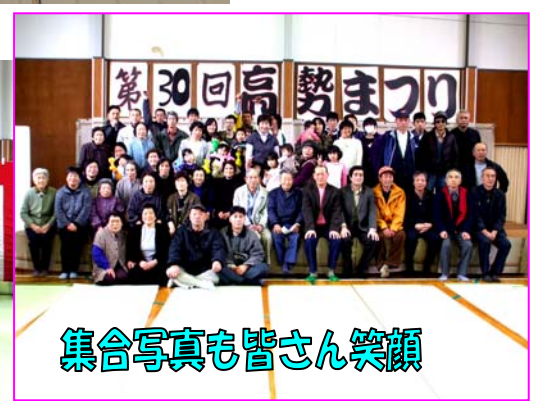
集合写真も皆さん笑顔