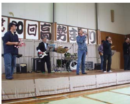
名曲演奏のとんがり倶楽部バンドの皆さん 三朝音頭の踊りで閉め