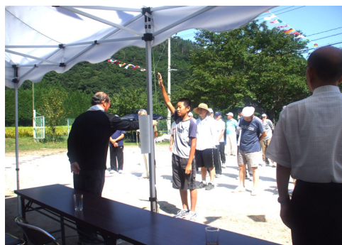
選手宣誓は6年生が誓います