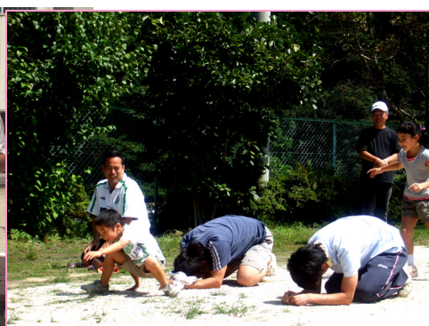
頭を蹴っても早くゴール