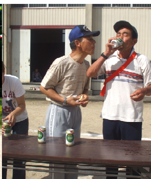
ノンアルコールの味はどう！