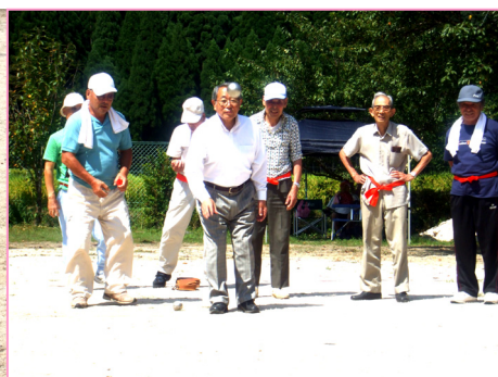
三朝町長さんの凄腕発揮