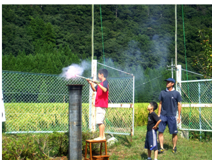
地域の特徴、開会式を盛り上げる小学生