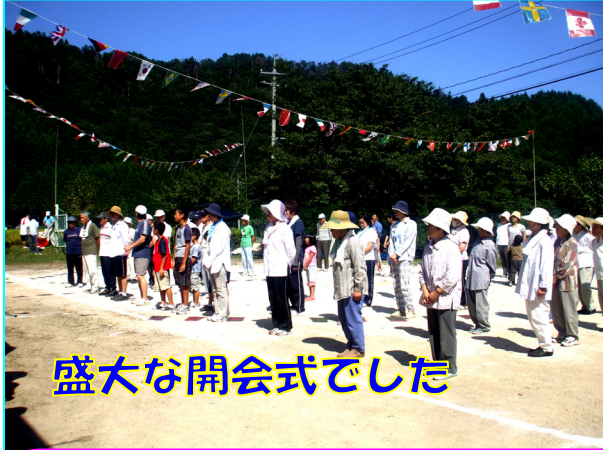
盛大な開会式でした