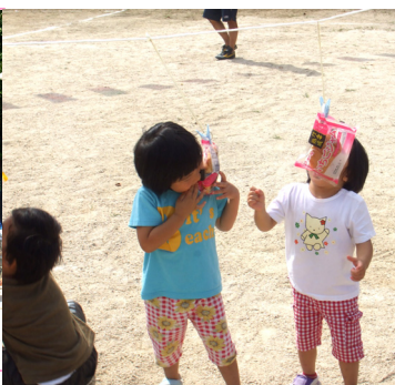
パンは手を使うのが一番よ！