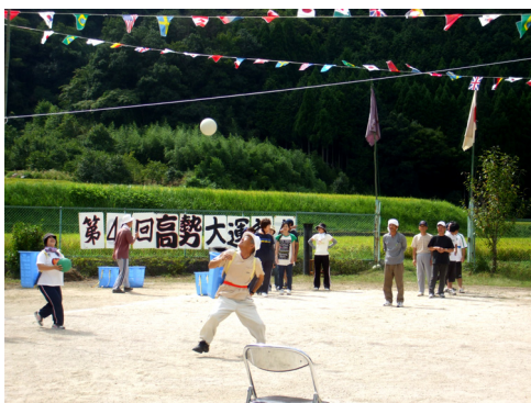
上手でしょう？と迷演技