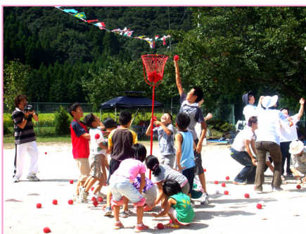
孫には負けても満足です