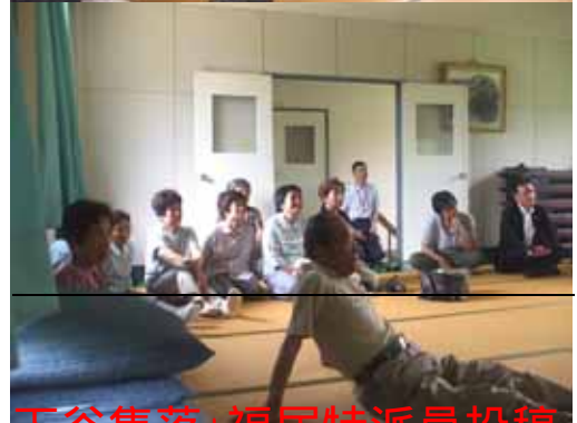
下谷集落・福居特派員投稿