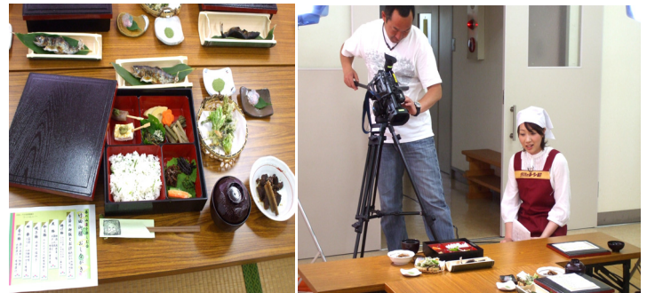
これが噂の『竹田御膳』

竹田地内で採れた山菜・山女魚を使った、「竹田御膳」が5月10日と17日の2週にわたり日本海テレビ「とっとり TRY!」で紹介されました。5月2日に1日かかって撮影をし、わずか2週合わせても10分弱という放送時間でしたが、皆さん見ていただけましたか。( ^ _ ^ ) 日本海テレビのホームページにも出ていますので、ぜひ見てくださいね！