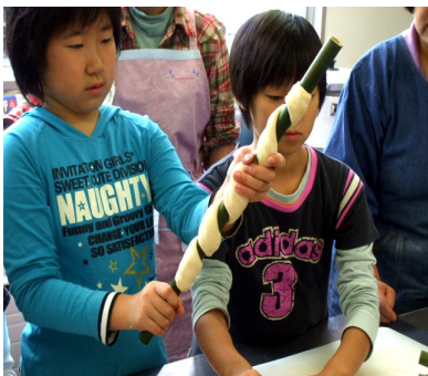
生地を袋から取り出し、伸ばして竹に巻きつけたあと、炭火でゆっくり焼きます。