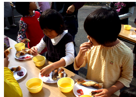
竹からはずしてジャムなどで食べます。

今回2つの会で作ったパンのレシピを紹介しておきます。簡単なので是非挑戦してみてください！！