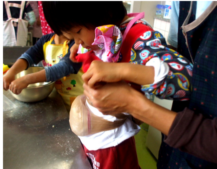
ナイロン袋に入れてお腹に巻きます。