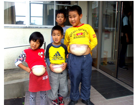
しっかり膨らみました。