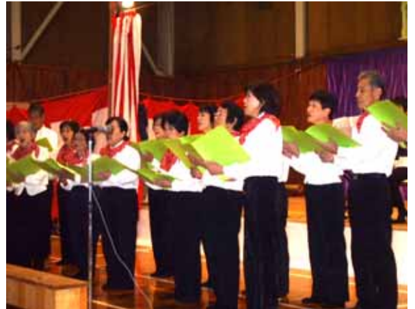
下西谷によるコーラス