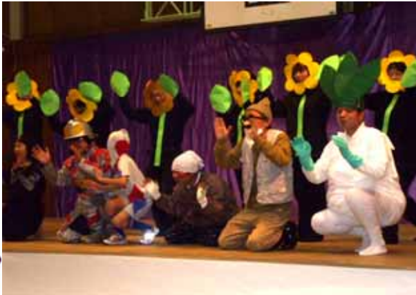
久原の「大きな大きなカブ」

また作品展にもたくさんの方にご協力いただき、バザーも早いうちから売り切れになる集落もあり大盛況でした。 当日の様子をすこし・・・