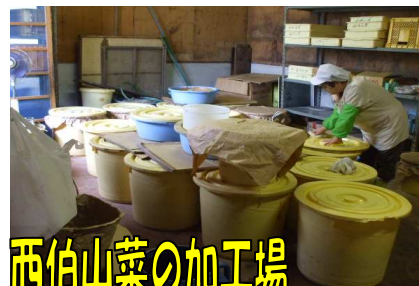
西伯山菜の加工場