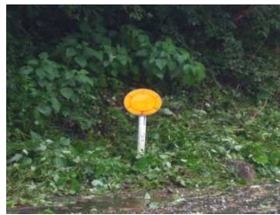
標識も草の中から顔をだしました