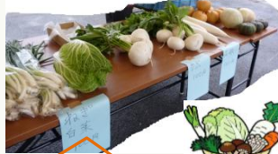
今回もたくさんの野菜が並びました