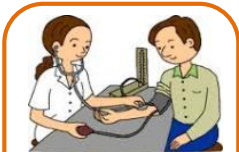
当日は血圧測定もありました。