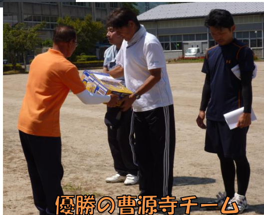
優勝の曹源寺チーム