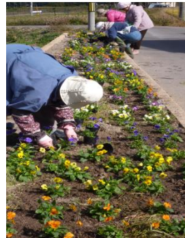
草を取って新しく花を植えました。