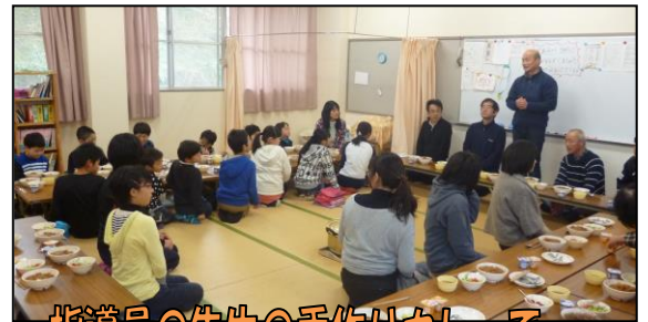
指導員の先生の手作りカレーで。

平成29年度も盛りだくさんの内容で引き続き開催して行く予定ですので、どうぞよろしくお祈りします。