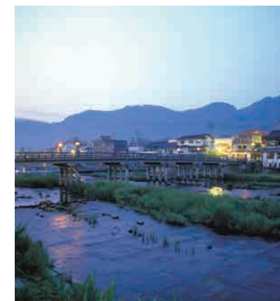
温泉街・夏の夕暮れ