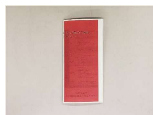
未着手(赤面を提示)