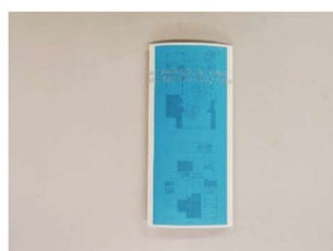
着手済(青面を提示)