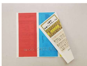
三折式パンフレット