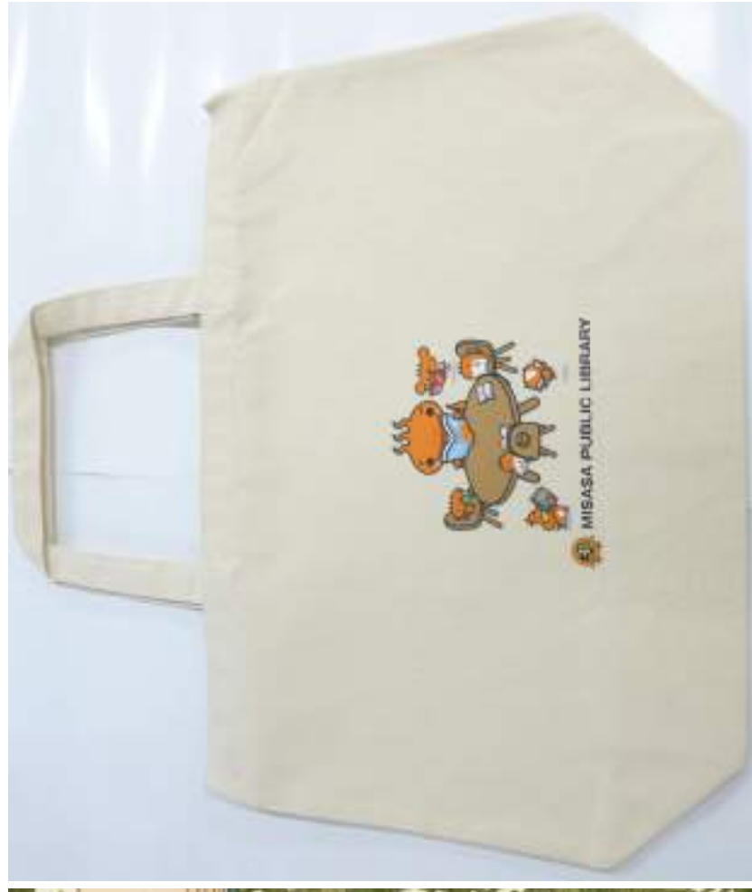
ミササラドン 図書バッグ