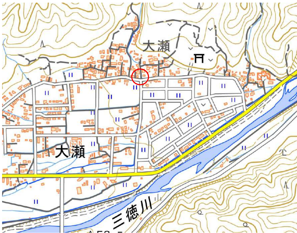
位置図（町道大瀬中央線）