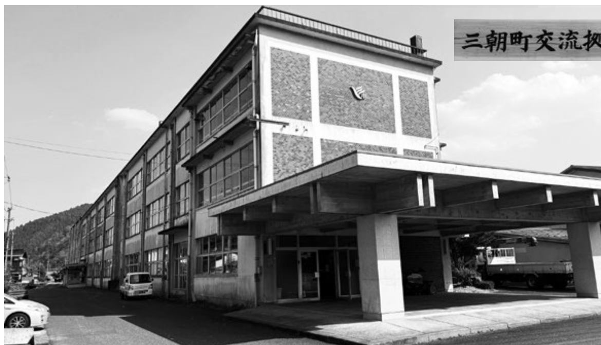
三朝町交流拠点施設

地域課題の解決に向けた取組を持続的に進めるための活動を行う地域住民を中心とした地域の関係者が参加する組織