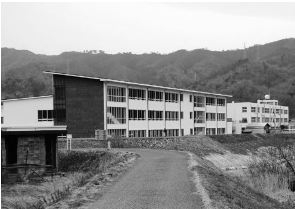
三朝小学校・中学校

ない。そういうことも踏まえて、何時でもどこでも自分学びたいことが楽しく学べるよう生涯学習推進プランの実施に取り組んでいきたい。