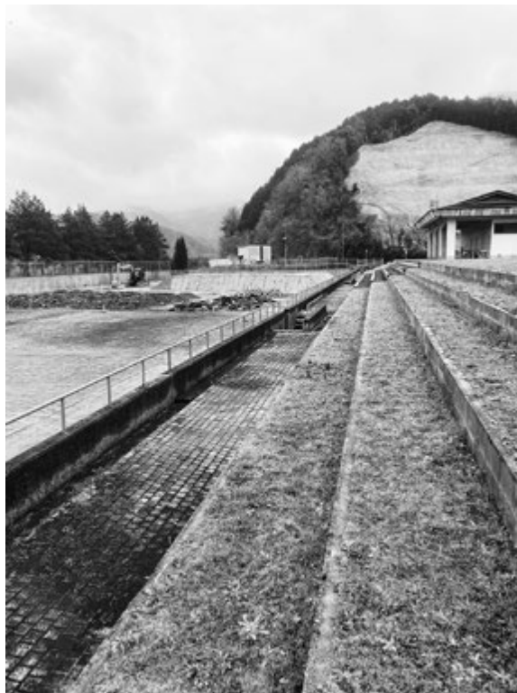
防災広場予定地 (多目的スポーツ広場)

活用面では、消防団等の訓練活動、住民を対象とした避難訓練や消火訓練を想定している。現在の多目的スポーツ広場の利用者は継続して利用できるように考えている。また、スケートボードでの利用もできるように考えたい。