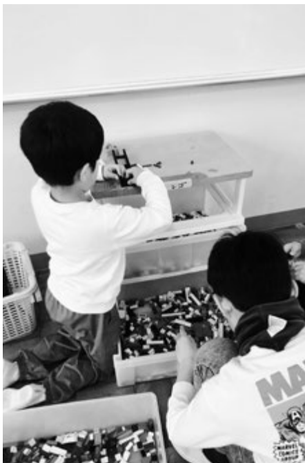
三朝西学童クラブの様子

公設民営化を進める中、若い世代への支援を含め、現状のままではニーズに沿ったサービスの提供は困難であると感じる。答申に基づき、アンケート等を通じて具体的な対策を迅速に進めていきたい。