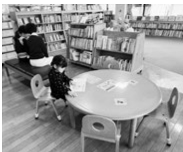
利用者の憩いの場に

滞在型へ劇的に役割を変化させている。資料保護と利便性の両立を図るとともに、時代の変化に合わせ、今後も町民に愛され続ける図書館となるよう施設設備の有効活用と空間の最適化に努める。