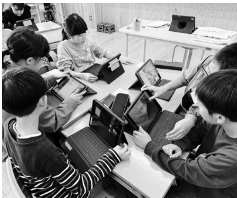
タブレットでの授業風景（小学校）